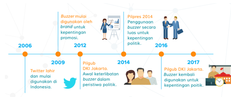
Gambar 2. Timeline Perkembangan Buzzer (Balik Fenomena Buzzer, n.d.)

motivasi tertentu untuk beriklan. Sebuah gerakan sosial yang dimotori tagar #Indonesiaunite di platform media sosial seperti Twitter dielu-elukan secara luas sebagai respons efektif terhadap peristiwa bom Jakarta saat itu. Sebelumnya itu, banyak produk yang ternama menggunakan buzzer agar dapat membantu strategi pemasaran produk mereka. Pada level ini, sosial media dipandang turut andil dalam banyak dinamika politik domestik yang berlangsung.