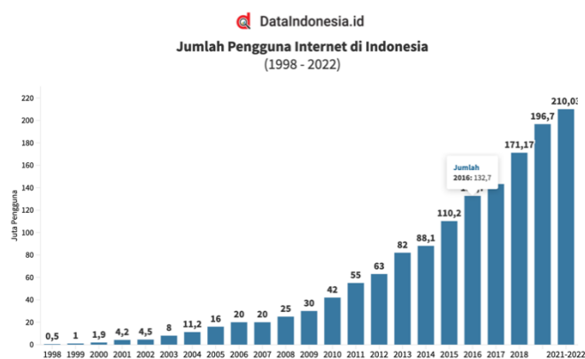
Gambar 1. Jumlah Pengguna Internet di Indonesia (APJII, 2023)

Setiap tahun, semakin banyak orang Indonesia yang bergabung dengan jajaran yang terkoneksi internet. Akan ada 210,03 juta pengguna internet di Indonesia pada 2021-2022, demikian temuan studi Asosiasi Penyelenggara Jasa Internet Indonesia (APJII). Angka tersebut naik dari season sebelumnya sebesar 6,78 persen atau 196,7 juta penonton. Artinya, 77,02 persen masyarakat Indonesia kini memiliki akses internet. Persentase orang berusia 13 hingga 18 tahun yang memiliki akses internet adalah 99,16 persen, menjadikan mereka kelompok usia dengan penetrasi internet tertinggi secara keseluruhan. Kelompok usia 19-34 tahun memiliki penetrasi tertinggi kedua, yakni 98,64 persen.