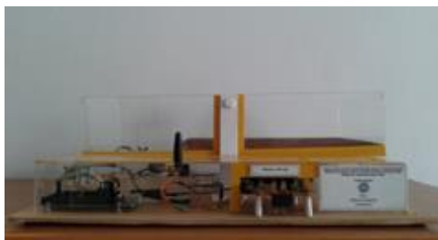
Gambar 2. Tampak Depan