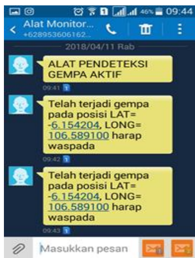
Gambar 6. Tampilan SMS Informasi Gempa