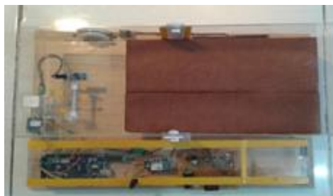
Gambar 3. Terlihat Alat Tampak Atas

Arduino Mega 2560 beroperasi pada masukan daya 6 volt hingga 20 volt. jika diberi tegangan sebesar 7 volt maka hasil output pada pin 5 volt akan kurang dari 5 volt, namun jika diberi tegangan 12 maka papan board arduino akan cepat panas dan dapat merusak board Arduino Mega 2560. Pin tegangan pada Arduino Mega 2560 diantaranya pin VIN, 5V, 3V3, GND, dan IOREF. Untuk memory Arduino Mega 2560 memiliki 256 KB flash memory, 8 KB SRAM dan 4 KB EEPROM. Komunikasi Arduino Mega 2560 memiliki 4 komunikasi serial UART TTL 5 volt. Untuk pemrograman digunakannya bahasa C dengan software Arduino IDE. Penggunaan Arduino Mega 2560 sendiri digunakan sebagai pengendali dari keseluruhan sistem kerja alat yang mudah untuk digunakan dalam merancang sistem monitoring gempa menggunakan sensor getaran serta gps notifikasi melalui sms berbasis Arduino Mega 2560.