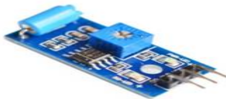
Gambar 4. Modul SW-420

sensor getaran mendeteksi adanya getaran maka sensor getaran akan terputus dan memiliki nilai output yang tinggi yang ditandai dengan lampu indikator pada modul sensor getaran mati atau tidak menyala. Untuk output dari besaran yang didapatkan saat terdeteksinya getaran akan langsung terhubung pada mikrokontroler Arduino Mega 2560 untuk mendapatkan atau diketahuinya nilai ADC baik tinggi maupun rendahnya sehingga dapat terlihat apakah terdeteksi adanya getaran atau tidak ada getaran. Adapun bentuk dari modul sensor getaran SW-420 dapat terlihat pada Gambar 4.